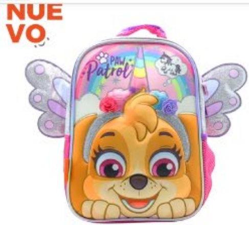
Mochila Cresko Paw Patrol Espalda...