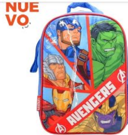
Mochila Cresko Avengers Espalda... MODELOS VARIOS