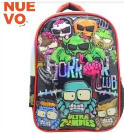
Mochila Cresko Zombie Espalda ...