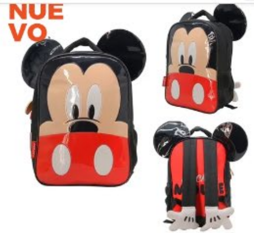
Mochila Cresko Mickey Espalda ...